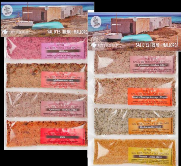
Código 21108 - BOLSA PACK 4 SABORES 140g (35x4)

Combinaciones indefinidas y aleatorias de 4 sabores presentados en bolsa de plástico y una postal con imagen de Mallorca.