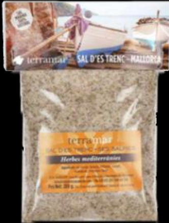
Código -21100 Herbes Mediterraneas